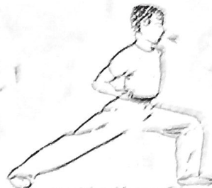
10 - Posición SU RIO PU 11 - Posición FU FU PU 12 - Posición KON CHEN PU