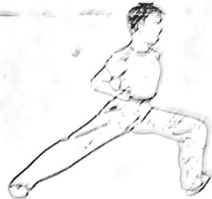
7- Posición CHEN CHAN PU 8- Posición CHUY PIEN PU 9- Posición CHAN SEN PU